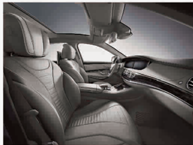
■ 全新S级轿车的内饰堪称个人豪华主义典范

鲜明的轮廓，柔和的过渡，性感的曲面，刚柔并济。传承了耐人寻味的经典架构和流畅轮廓，全新S级轿车拥有修长的发动机罩和流畅圆润的顶部线条，最后以舒缓下倾的线条衔接并收尾，在尺寸和空间设计上恰到好处。