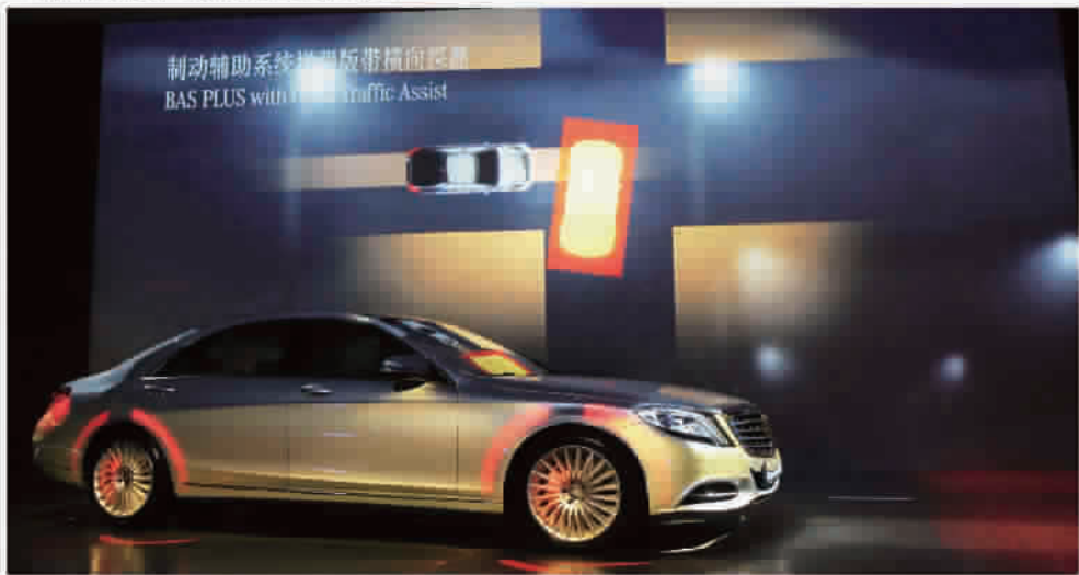
■ 全新S级轿车智能驾驶系统

而标配的ECO启动/停止功能则成为优异燃油高效性和超低排放量的有效助手。在所有车型中，S 400 L HYBRID混合动力车型无疑是全球豪华轿车中最具燃油经济性汽油机轿车的领跑者。其综合油耗仅为百公里6.9升，比前代车型降低了20%，164克/公里的二氧化碳排放量同样也创下了该汽车细分市场的新记录。而S 400 L搭载了奔驰最新3.0升BlueDIRECT双涡轮增压发动机，最大输出功率为245千瓦，峰值扭矩达到了480牛·米。而在V8双涡轮增压发动机的驱动下，S 500 L输出功率达到了320千瓦（435马力），峰值扭矩可达700牛·米，仅为4.8秒。