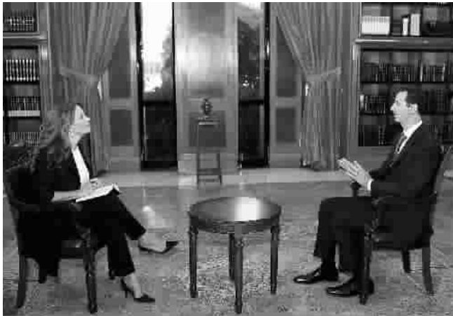
■巴沙尔接受意大利电视台采访