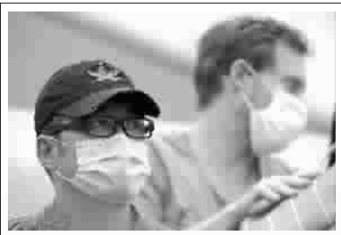
北京再现雾霾天, 观众戴口罩观赛中网一景 图〇