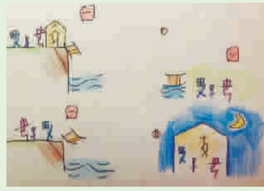
(延安初中学生的美术作品)

关, 汉字经过简化会失去原有的一些结构特征和表意作用, 这就要求老师把每一个字都尽可能讲透, 让学生慢慢品味汉字演变的历程, 了解汉字背后的文化渊源。