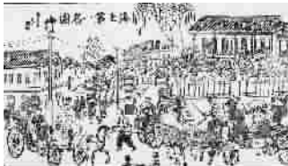
▲ 清末描绘张园和上海小校场年画

沿着繁华喧嚣的南京路一路向西，拐进深幽狭窄的泰兴路，穿过略显嘈杂的吴江路，一座铁艺牌坊赫然在列，匾额上写着大大的“张园”二字。穿过牌坊，一幢幢石库门住宅顿时映入眼帘，红砖青瓦，白色门头，亦中亦西，仿佛一下进入那一段旖旎的摩登时光。今年年底，正是张园中的第一高楼安垲第建成120周年，就让我们重温一下当年安垲第的盛世。