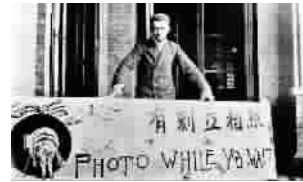
▲ 1907年张园万国赛珍会上的外国人照相摊位