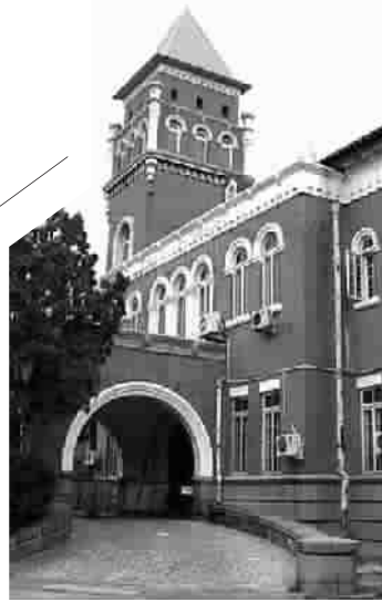
▲ 现在的张园安垲第