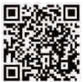
衢州旅游安卓客户端下载二维码