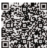
衢州旅游苹果客户端下载二维码