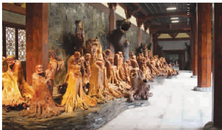
国家5A级景区——根宫佛国文化旅游区