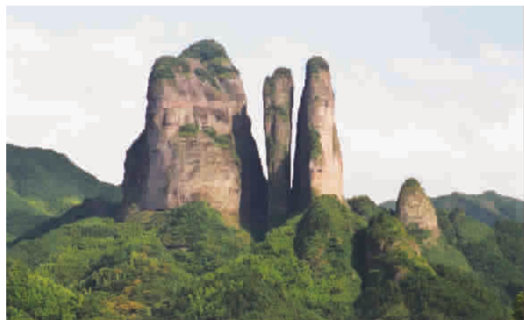
江浙沪唯一的世界自然遗产江郎山

美食: 在衢州的名胜景点,游客可以品尝到味美可口的农家菜,衢州名菜“三头一掌”(兔头、鸭头、鱼头、鹅掌)风味独特。衢州有众多土特产,全市有蜂产品、龙顶茶、胡柚、白莲等19个中国特产之乡。