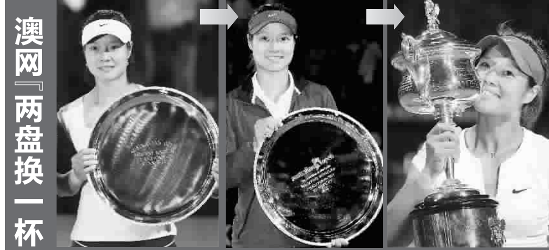
■ 2011年1月29日,李娜在颁奖仪式上手持亚军银盘 ■ 2013年1月26日,李娜在颁奖仪式上手持亚军银盘 ■ 2014年1月25日,李娜在澳网女单决赛后手捧冠军奖杯

跨越而立之年,李娜终于在最爱的澳网如愿夺得了职业生涯第二座大满贯奖杯。在北京时间昨晚进行的澳网女单决赛中,中国金花李娜以7比5、6比0击败赛会20号种子齐布尔科娃,成为百年澳网历史上首个获得冠军的亚洲球员。“娜”些关键词解读李娜夺冠的台前幕后。