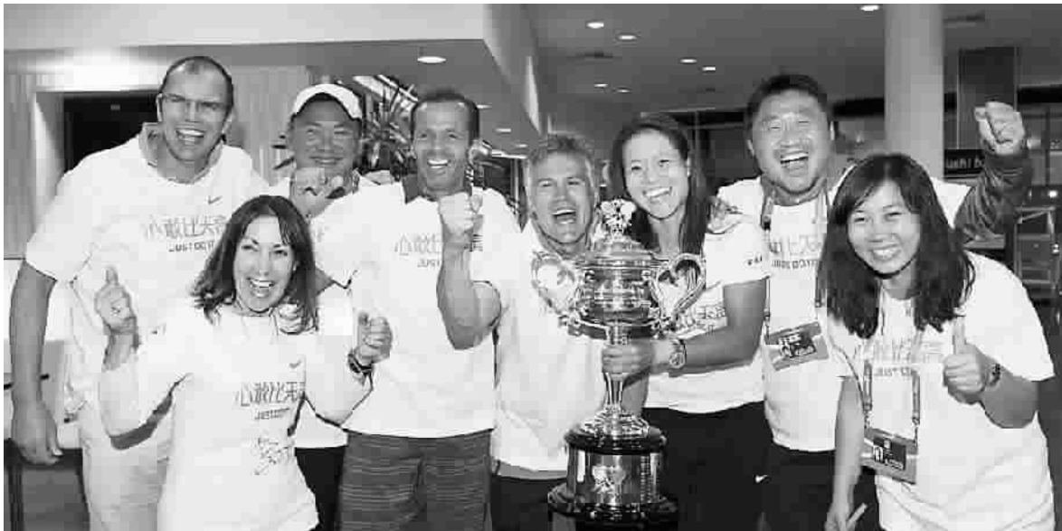
■ 李娜(右三)自己的工作团队一起庆祝

第三次打进决赛,李娜终于成为了幸运儿,前两次澳网决赛她都输掉了,一次是2011年对阵克里斯特尔斯,一次是2013年对阵阿扎伦卡。今年澳网第三轮,她在面对萨法洛娃时被对手拿到了赛点。今天,她也成为了在公开赛年代第四位挽救赛点后赢得澳网的女运动员(前三位是塞莱斯、卡普里亚蒂和小威康姆斯)。 ——WTA官网