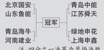
足协杯八强对阵图

出乎意料,仅仅是足协杯的1/8决赛,广州恒大居然就倒下了!昨晚,他们客场1比2遭遇保级球队河南建业大逆转,提前告别足协杯,“三冠王”的美梦无法再延续。亚冠冠军只打到足协杯16强,足以令外界大跌眼镜。