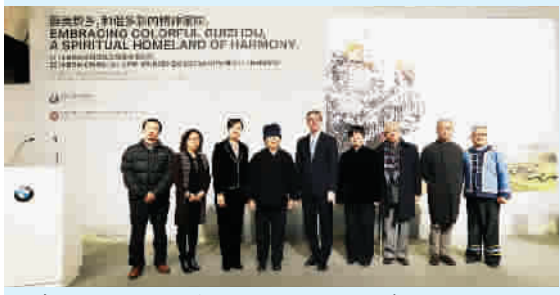
▲ 参加2014“BMW中国文化之旅”回顾展嘉宾大合影