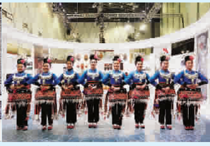
▲ 苗族芦笙舞(锦鸡舞)现场展演