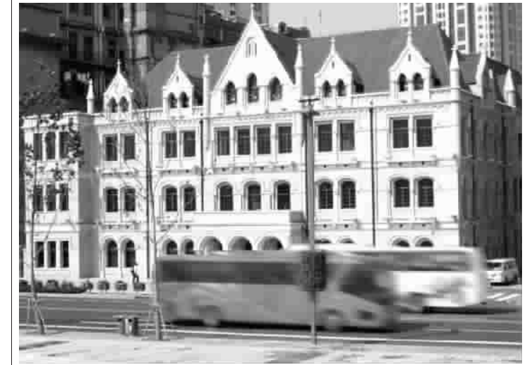
上海是一个开放包容的城市,走在外滩瞭望浦东,高低起伏的摩天大楼就像正在演奏的现代音乐,浦西的万国老建筑群就像凝固的古典音乐,这种现代乐和古典乐隔着黄浦江奏起的乐章,让人赏心悦目。

出人意料的是,不少凶恶残忍的动物也舔犊情深。鳄鱼是嗜杀成性的家伙,可它却是爬行动物中出类拔萃的慈母。每当繁殖季节,鳄鱼爬上陆地,将出生的卵细心地埋在自己早已挖好的沙坑里。在此后九十余天的漫长孵化期里,鳄鱼忍饥挨饿,严守卵侧,一直到“儿女们”降生于世;别看母狼凶恶残忍,但对其子女却倾注爱抚,当它遇到走失的幼狼或小孩时,就赶快叼进狼窝,用乳汁精心哺育。世界上发现的“狼孩”便是其“慈母心”的佐证。