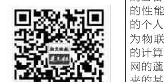
扫一扫,关注“夜光杯”

值得提醒:泡茶一般冲水加盖5-6分钟后饮用,陶器、紫砂壶等茶具均可使用,药用泡茶时间以饭后半小时为宜,不宜其他零食同服,以达慢养趣性疗疾防病之效。简而言之,西药疗急,煎药疗病,药泡防病,泡茶养性,各有门道。(作者为上海市中医医院副主任医师)