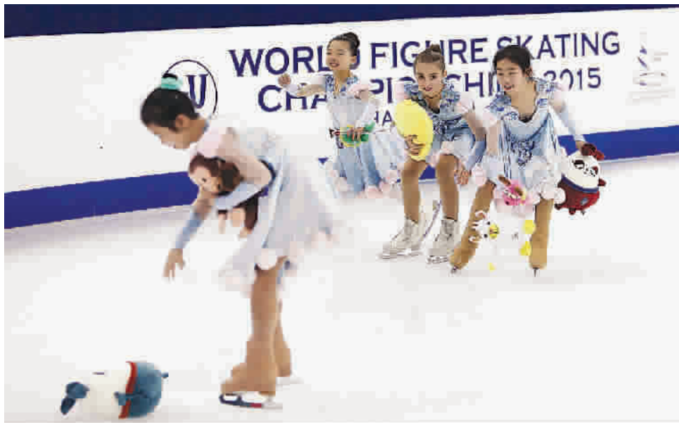
小冰童在冰面上收拾观众们扔下的毛绒玩具