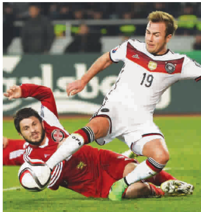
德国队欧预赛胜格鲁吉亚, 格策(右)带球突破

2015 年 4 月 15 日, 上海大剧院, 看德国足球队能否捧起劳伦斯最佳团队奖奖杯。本报记者 陶邢莹