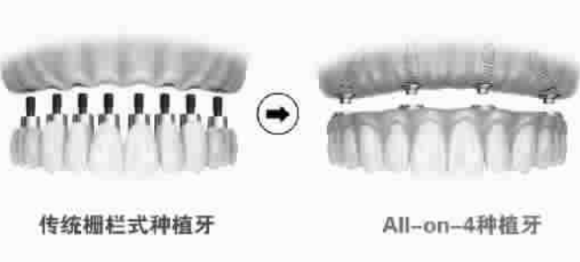
传统栅栏式种植牙

免费 360 度全景仪全口拍摄 免费专业口腔健康评估 免费专家量身定制种植方案 牙齿关爱基金 2888-6888 元不等。