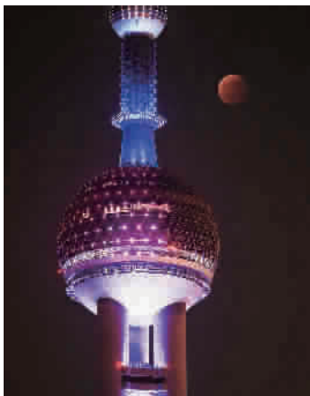
■ 2014年10月8日,上海,月全食“红月亮”如期现身上海夜空

■二〇一四年十月八日晚廿二时许,「红月亮」完全露脸,高挂苍穹,映衬着江苏南通国家5A级濠河风景区,流光溢彩,璀璨夺目,分外妖娆