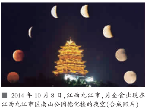
■ 2014年10月8日,江西九江市,月全食出现在江西九江市南山公园德化楼的夜空(合成照片)