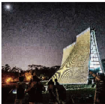
■ 2014年10月8日,台湾中部地区夜晚晴朗,可用肉眼观看月全食现象,东海大学校区内聚集许多天文迷拍摄天文奇观

日食与月食,都是很值得观测的天象。今年内共有日食和月食各两次。就我国境内而言,除了3月20日这次日全食在新疆北部地区能见日偏食外,惟有4月4日这次月全食全国各地都均看到。本次月全食可见区域是在北美洲西部、太平洋、大洋洲、亚洲东部和南极洲大部。见食时刻(北京时间)是:初亏18时15分,食既19时54分,食甚20时00分(食分1.006),生光20时06分,复圆21时45分。呵呵,如此好的机会,不要错过噢。