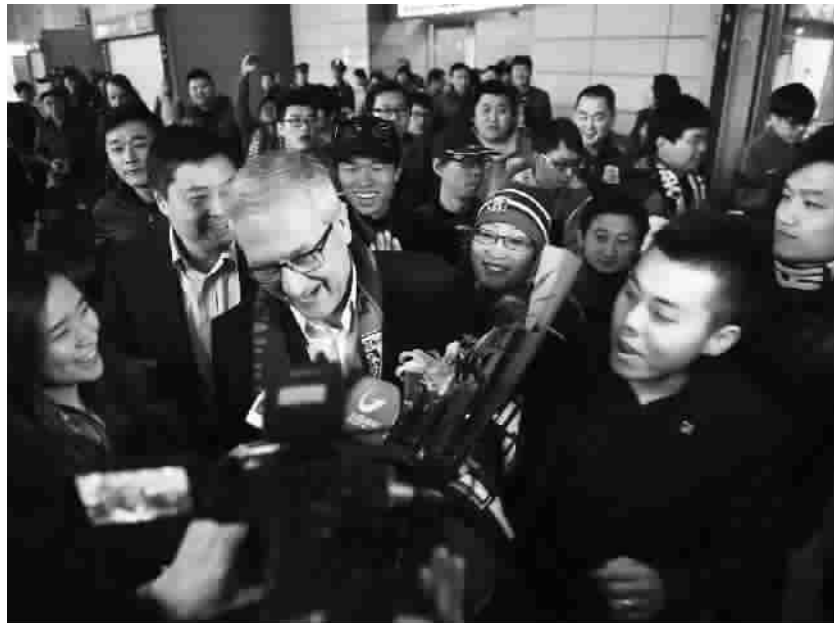
曼萨诺在浦东机场受到球迷欢迎