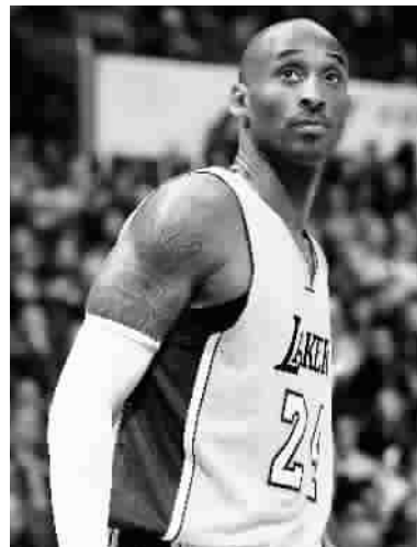
科比的比赛,看一场少一场了