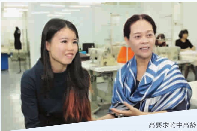
高要求的中高龄人群

律动的节奏、轻盈的步履、超前前卫的设计……这场秀没有呈现这些伸展台上的常见元素,少了时尚的锋利,取而代之的是历经沉淀的从容稳重与优雅得体。最近,由上海视觉艺术学院发起的中高龄时尚服饰秀正精彩上演。