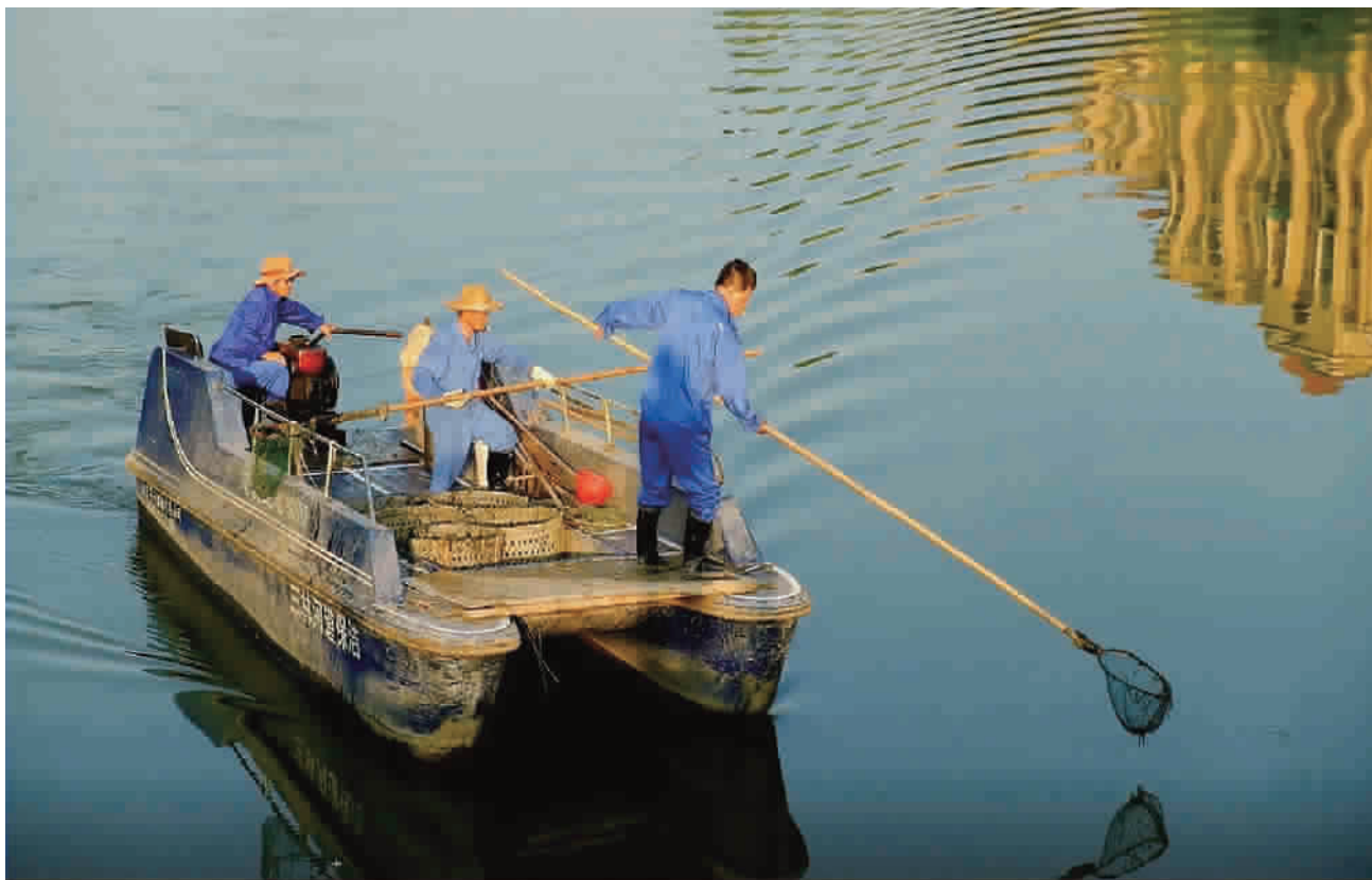
近年来,经过不断的治理,浦东三林塘变得越来越美丽,周边小区也引水入境,使景观河活了起来