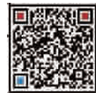
扫码加入“澳洲置业群”

主办方: 澳大利亚澳中房地产有限公司上海代表处 忠告语: 购买境外房地产项目有风险, 购房者应事先了解项目所在国家或地区的购房政策等。广告