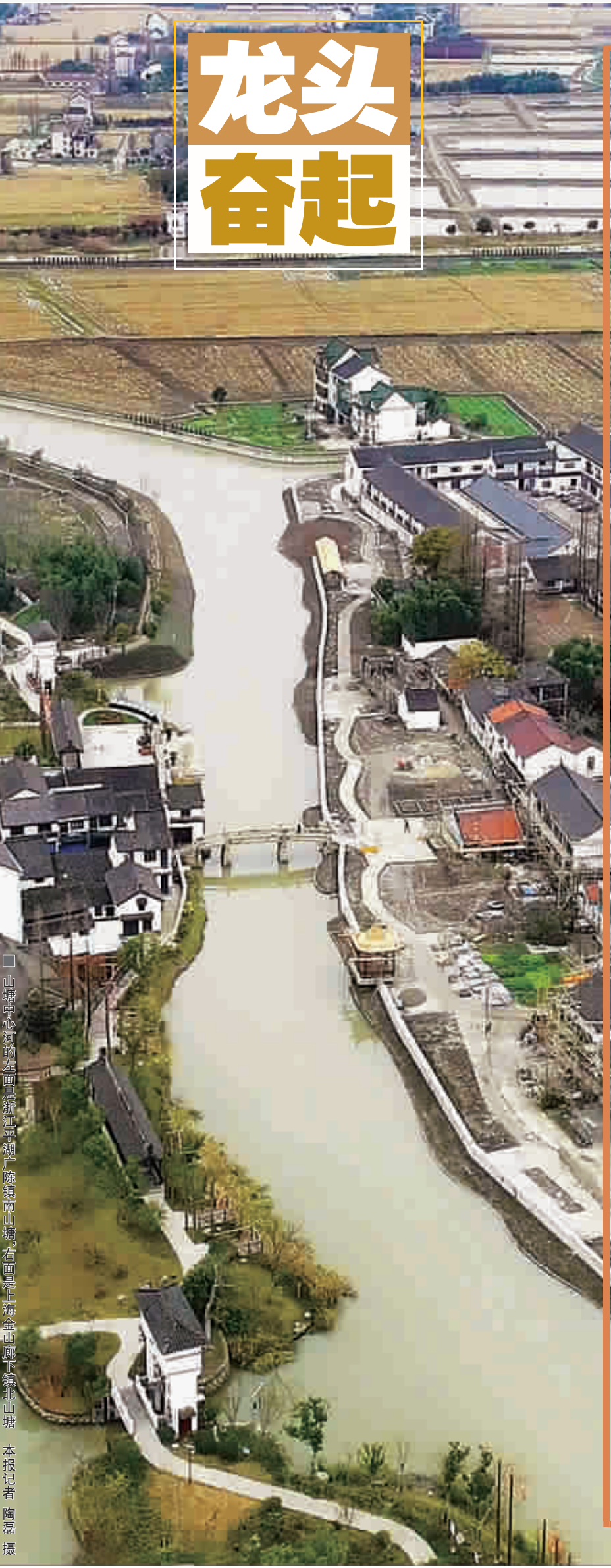
山塘河心河蜿蜒在古镇山塘，陈镇南山塘，右面是上海金山脚下脚下山塘