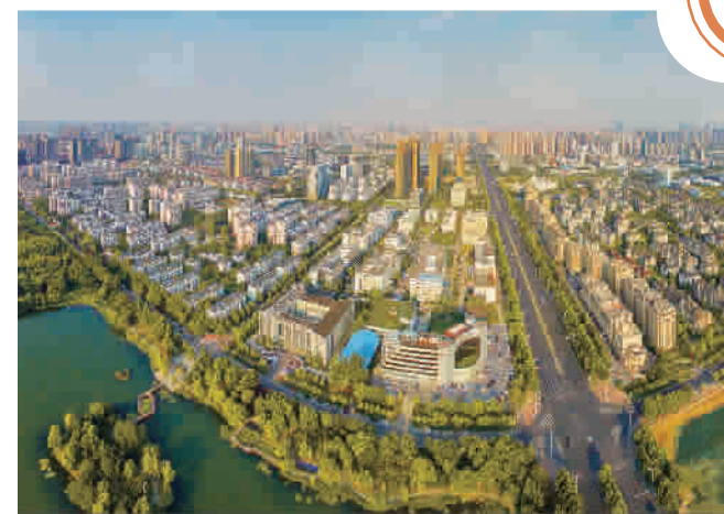
安徽合肥蜀山区及高新区