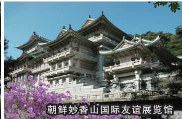
朝鲜妙香山国际友谊展览馆