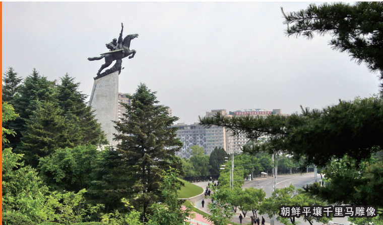
朝鲜平壤千里马雕像

绿,是春色,是生态,是健康;红,是血色,是生命,是缅怀——这是一次关乎生活与激情的旅行,这是一次瞻望历史与展望未来的旅行;来吧,无论年轻还是年老的您,加入我们“绿+红”的独特而难忘的7天旅程,会有些许意料之中或者意想不到的收获!