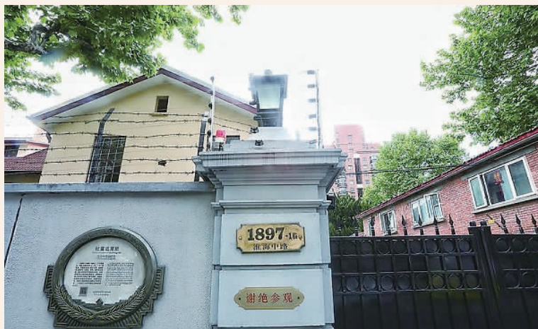
杜重远寓所承载满满的红色记忆 淮海中路上的杜重远寓所