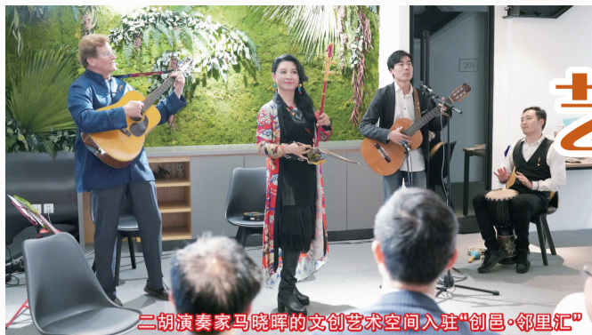
二胡演奏家马晓晖的文艺空间入驻“创邑·邻里汇”