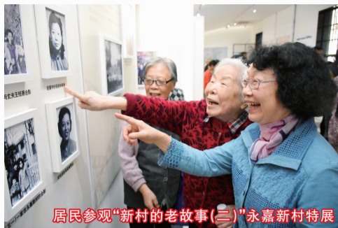
居民参观“新村的老故事(二)”永嘉新村特展

今年10月,闹中取静的永嘉路热闹起来。由居民自发组织、围绕永嘉新村社区文化的“新村老故事”特展第二期开幕,展览地还是小区门口那座从菜场修缮更新而来的“都市之光”公共艺术空间,策展人是来自英国的人类学博士王心远。 居民自办展览已是稀奇,找来专业学者帮忙更是鲜见。但在徐汇区天平路街道,居民们却认为,唯有找专业的人,才能挖掘和体现出最深刻的社区文化品质。 天平路街道位于衡山路——复兴路历史文化风貌区核心地带。今年3月,街道发布“漫步天平”微线路,沿途包括宋庆龄故居、杜重远故居、陶行知故居、陈毅故居、中共地下秘密电台旧址、田汉寓所、瞿秋白旧居等16处历史人文地标。同时发布的“人文底蕴”旅游微线路涵盖了上海京剧传习馆、上海中国画院、上海工艺美术博物馆、上海图书馆、衡山电影院等14个上海人耳熟能详的老牌文化场馆。通过微信公众号按图索骥,每个人都能找到心目中的文化殿堂。 天平路街道有个“名家坊”,一批居住、工作在天平的老一辈文化大家加入,还有中青年文化名家源源不断加盟。他们经常活跃在社区,为居民开设文化讲座、举办公益音乐会,这些原本要走进剧场、音乐厅才能见到的名家,成为社区文化传承大使。 今年4月,二胡演奏家马晓晖的文艺空间入驻天平路街道的“创邑邻里汇”,定期为居民们带来音乐雅集、大师对话、艺术赏析,以后还会有二胡与吉他、非洲鼓等不同乐器的融和演出,居民们不出家门就能纵览世界风土人情,领略最高品质的文化。 记者 舒抒(本文摘自2018年11月6日《解放日报》13版)