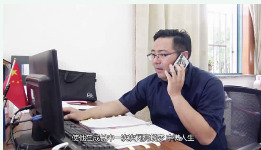
使他在成长中一次次闪亮蜕变,丰满人生

“小身材,大能量”,这是对金花老师的最佳诠释。她岗位上起表率、执教中求创新,工作成效显著,诠释了“园丁”的笃志不倦精神!