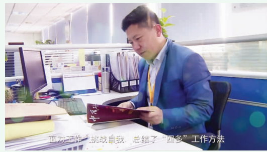
面对工作,挑战自我,总结了“四多”工作方法

丰富的工作经历使他在成长中一次次闪亮蜕变,丰满人生,以实际行动书写了基层党员的“青春榜样”形象。