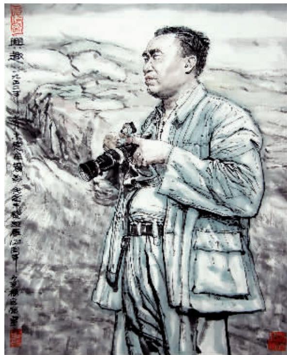
■ 朱德像 杨宏富作