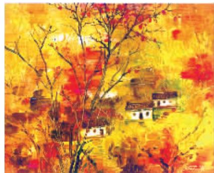
■ 山村 严德泰作