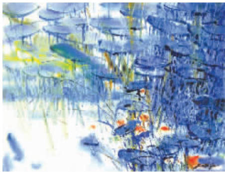
■ 雨中荷塘 严德泰作