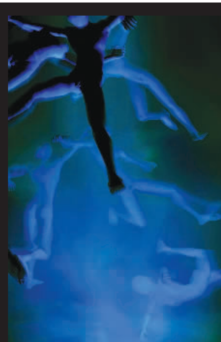
■ 我们重新认识自身的一切,在异样的空间里呈现陌生的躯体