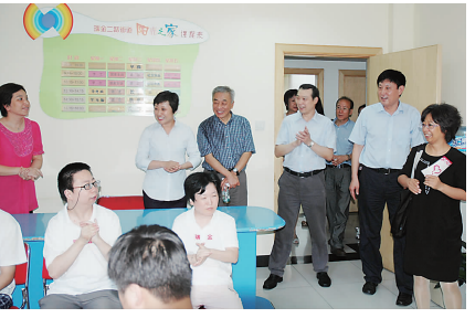
图为项目专家在瑞金街道指导