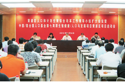
区综合改革领导小组会议暨七周期项目启动会

围绕加快“两区融合、一体发展”的总体要求,黄浦区坚持改革创新,深化和拓展国际合作项目。通过吸收、运用、提升、推广项目经验,推动人口计生工作的改革与发展。