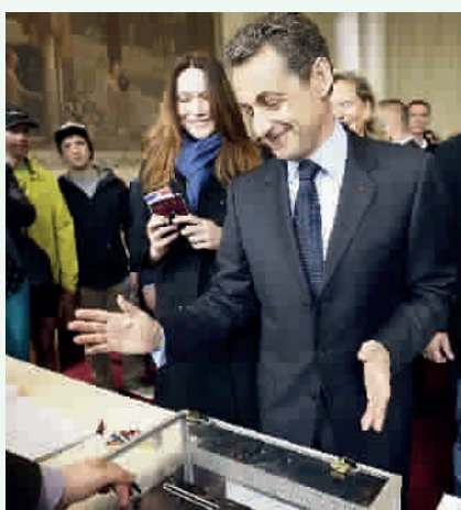
奥朗德与支持者共庆胜利 萨科齐在夫人陪同下投票

何以如此?恐怕要直接追溯到2008年的国际金融危机和接踵而至的欧洲主权债务危机。这两场危机,对法国传统社会模式和经济增长模式构成双重冲击。经济不景气、失业率居高不下、民众生活水平下滑、竞争力在全球萎缩、移民政策漏洞和恐怖主义泛滥对社会治安构成威胁……民众的不满情绪日益增长,对全球化竞争的恐惧心理弥漫。面对危机,法国民众普遍对现实不满,急于求变,这种情绪,构成了今年法国大选的主要社会氛围。 新华社记者 应强 李明