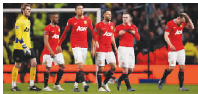
今晨输给曼城,意味着曼联可能丢掉英超冠军

难再阻止他们。他们必须在他们开始前阻止他们,因为他们可以夺得很多冠军,所有伟大球队都是这样开始的。如果曼城今年夺得联赛冠军,他们将翻开新的一页,那将是一场革命。”