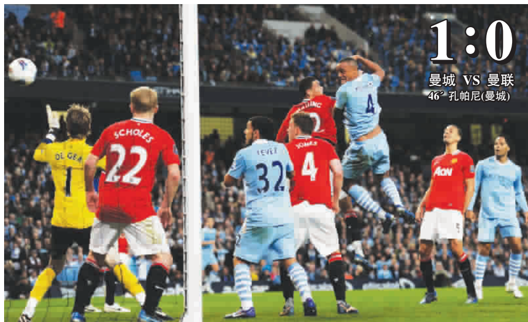
孔帕尼(右三)跃起头球,帮助曼城双杀曼联

23 如果曼城和曼联都赢得最后两轮英超胜利,将以净胜球决定冠军归属。英格兰顶级联赛上一次以净胜球分出冠军还是在23年前的1989年,当时阿森纳力压利物浦。