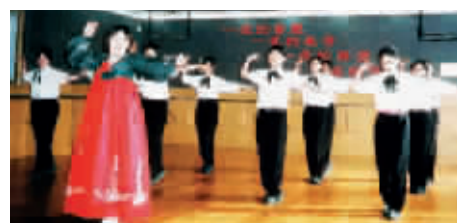
■ 旅游韩语专业的学生在向韩籍教师学舞蹈

旅游外语(英/日/韩)专业,拥有英、日、韩三个语种,是目前上海市的紧缺人才专业。主要培养具有熟练的英、日、韩语听说能力的中高级技能型人才,能胜任旅游行业的相关工作。主要面向旅行社、旅游景点、会议展览中心、旅游电子商务公司等旅游企事业单位。该专业学生经上海市旅游局特批,参加全国导游资格证的考核,合格率连续十年在上海市所有院校(含本科、高职、中专、职校)中名列前茅。