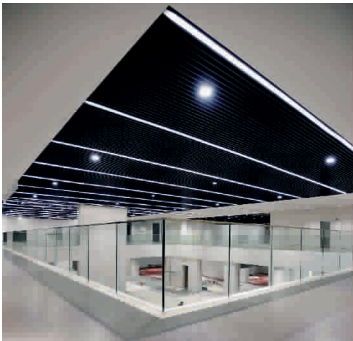
■ 从艺术宫二楼望见的巨大空间，即将被众多展品填满