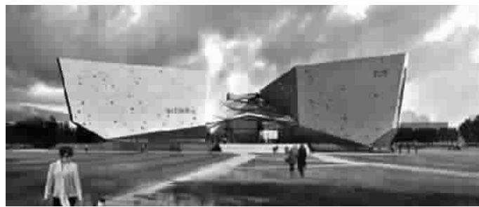
■刘海粟美术馆新馆正门外观效果图