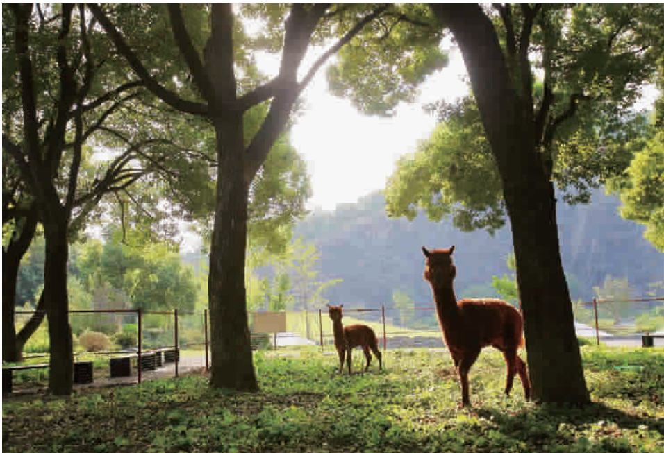
两只可爱的羊驼漫步在绿树下,享受秋日的阳光

“十一”长假,在温室“热带花果馆”的棕榈广场和“德中同行”竹亭内,将分别举办管弦乐、江南丝竹以及评弹的欣赏活动。此外,“德国摄影师眼中的上海”摄影展也将在“德中同行”竹亭展出。