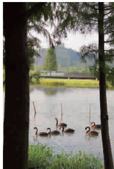
黑天鹅在湖水中展现着优美的身姿