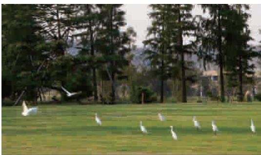
良好的自然环境吸引了众多野生白鹭