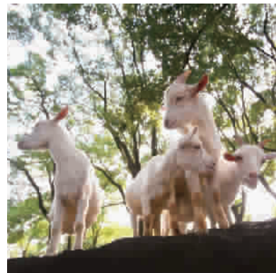
山羊爬到高高的石头上四处张望