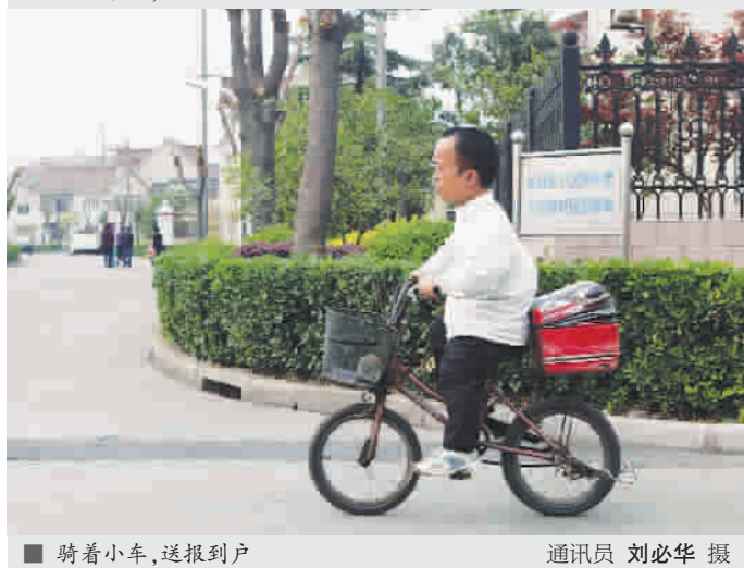
■ 骑着小车,送报入户