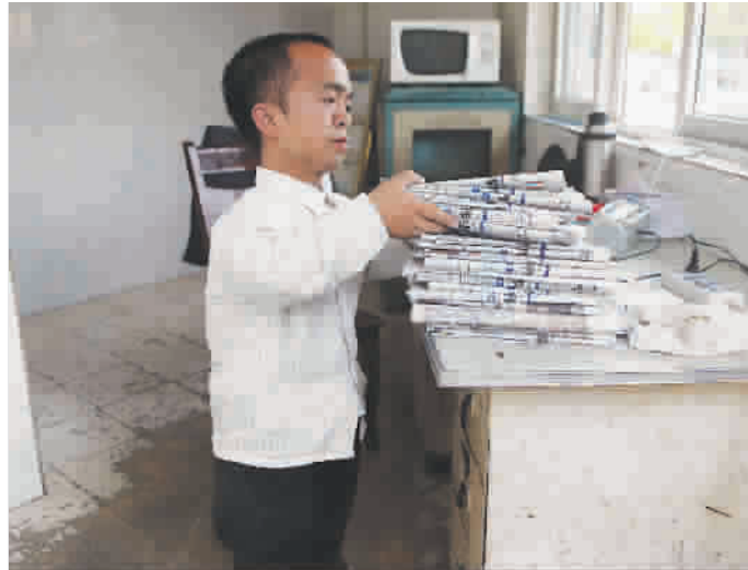
■ 报纸来了,先分一下