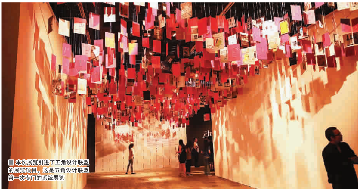
本次展览引进了五角设计联盟的展览项目,这是五角设计联盟第一次专门的系统展览