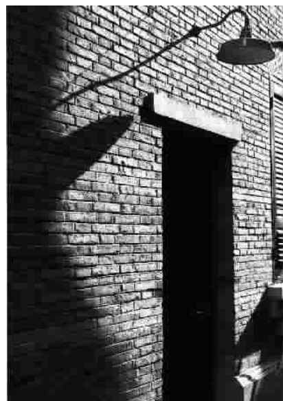
石库门建筑是上海最具特色的民居建筑,整齐划一外表砖墙,更能引起人们的怀旧