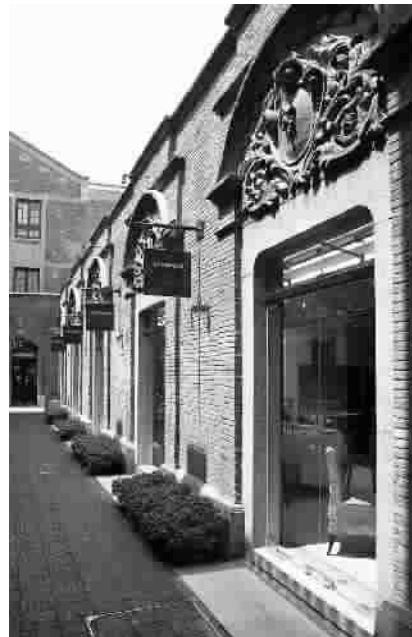
石库门建筑体现了上海海纳百川的中西合璧风格,传统的乌漆大门外边围着巴洛克式的装饰