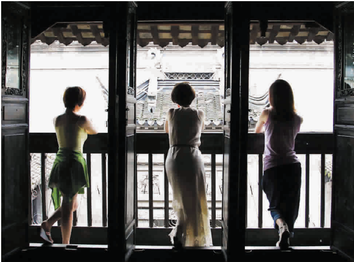
石库门形成了上海独特的艺术风情与文化,成为城市一道风景线