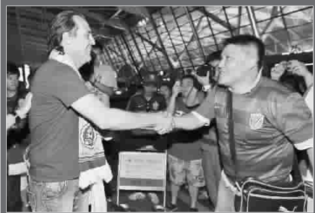
■ 球迷与巴帅握手告别