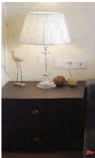
▲ 通透的玻璃底座，配上高透光的淡色灯罩，光线柔和，让心情也降温

添置一款造型如冰块或水波的台灯，冰凉感十足；又或者放上几盏玻璃香薰灯，舒缓减压的同时也给心情降温；如果家中的装修风格为中式，可以选择莲花造型、走马灯造型的灯具。不想换灯具？那就直接更换灯泡或灯罩吧。一个低瓦数的冷光灯泡，配上高透光的淡米色或淡蓝色布艺灯罩，光线瞬间变得柔和，感觉自然清凉许多。