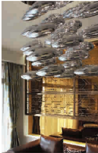
▲ 造型别致的吊灯，有种流动的韵律，给人视觉上的清凉与纯净感

水晶吊灯因其材质，会给人纯净冰凉的感觉，在购买水晶灯时，留意水晶的晶莹剔透与纯度有很大关系，纯度高的水晶内部没有裂痕、气泡、水波纹及杂质，反射、折射的效果更佳，使穿过的光出来后形成绚丽的色彩。其实，如果不是新装修，可少变更照明范围较广的吸顶灯、吊灯，转而多用光线柔和、有局部照明效果的台灯、落地灯、壁灯等。