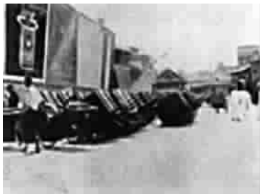
■ 停靠在码头的粪车