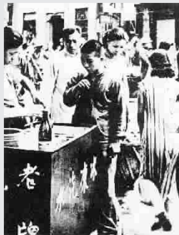
■ 上海闹市街头的冰冻汽水营业点