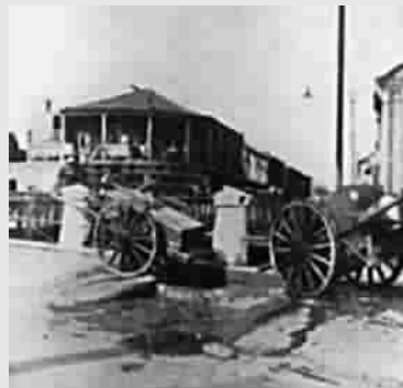
■ 旧上海的手推垃圾车