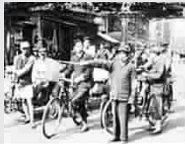
■ 摊贩协助维持交通

每年夏天,环境卫生是影响市容整洁与市民健康的首要因素。回首64年前的今天,上海解放不久,当时,战后遗留下来的盔甲、碉堡、尸体遍地狼藉,粪便、垃圾也因城市的围攻未能清除,而市内交通、治安曾一度出现混乱状态。正值夏令,为避免疫病流行,人民警察首先肩负起市容卫生、环境清洁、防疫保健、治安交通等多项职能。