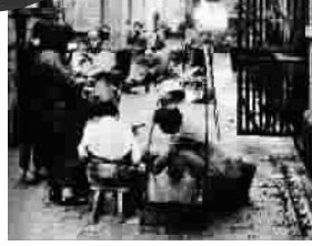
■ 石库门弄堂里的小商贩

在国民党的统治剥削和长期盘踞下,上海繁荣的工商业经济逐步走向萧条没落。大批失业职工、破产中小商人和贫苦群众为生活所迫沦为摊贩。1947年全市有摊贩12万户。解放初期,摊贩数量激增,创下空前纪录。南京路、中正路、林森路、金陵路等上海最主要交通干线的人行道、马路旁都摆满了摊贩。仅金陵路短短一段,摊贩就有七八千之多。倘若算上全市十多条繁华路段,最低估计在16万左右。究其原因主要是:国民党溃败撤退前,遣散、裁撤大批员工,他们不得不以最简单的谋生方式,设摊营业;工厂倒闭或歇