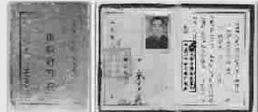
■ 1949年颁发的摊贩许可证