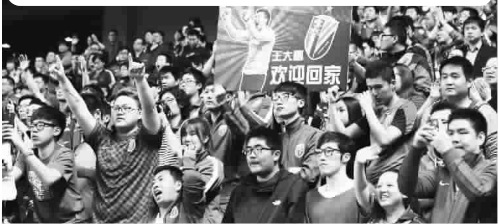
■ 上海球迷欢迎大雷回家