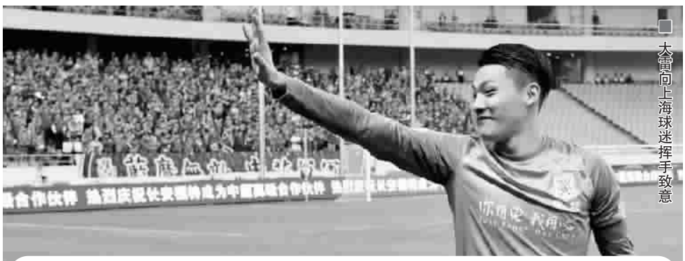
■ 大雷向上海球迷挥手致意

华金表示,首次在上海开办的皇马基金会足球夏令营注重品质,除了外籍教练之外,连训练器材都是从马德里空运而来。“我们希望来这里的孩子有一次与众不同的体验,喜欢上足球这项运动。”