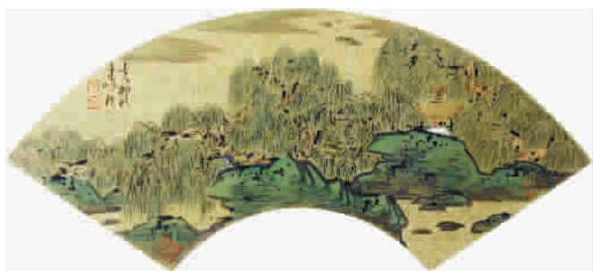
■ 车鹏飞《春江柳荫图》