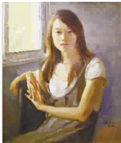
■ 魏景山《坐在窗旁的女孩》