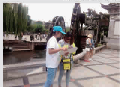
图为“月亮天使”降临云南丽江古城

此次活动是由蓝月亮公司主办的第二届“蓝月亮节”的系列活动之一。让我们一起期待与“月亮天使”的相遇吧!