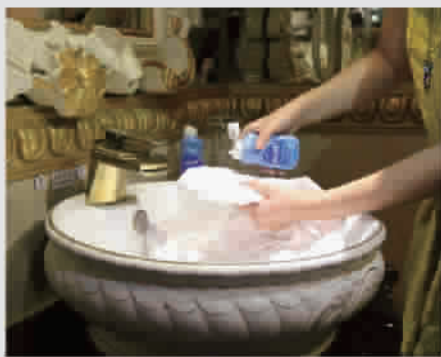
图为旅客在酒店体验洗衣神器

为了让更多的旅客能体验到《爸爸去哪儿2》中的旅途洗衣神器,“月亮天使”们在这个夏天携带这款神器降临在上海的外滩、豫园、城隍庙、欢乐谷等景点,与游客进行“亲密接触”,将洗衣神器送到游客的手中。