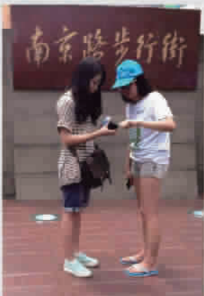
图为“月亮天使”降临上海,给旅客带来洗衣神器

此次活动是由蓝月亮公司主办的第二届“蓝月亮节”的系列活动之一。让我们一起期待与“月亮天使”的相遇吧!