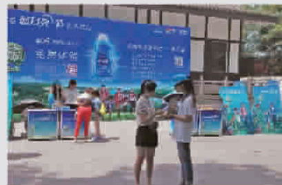
图为“月亮天使”降临都江堰

除了上海,“月亮天使”还降临到都江堰、云南丽江古城、洛阳龙门石窟、厦门鼓浪屿、北京南锣鼓巷等著名景区,将这款洗衣神器送到旅客的手中,为他们的旅途先衣带来改变,让轻松和洁净的体验伴随着旅客们一路前行。