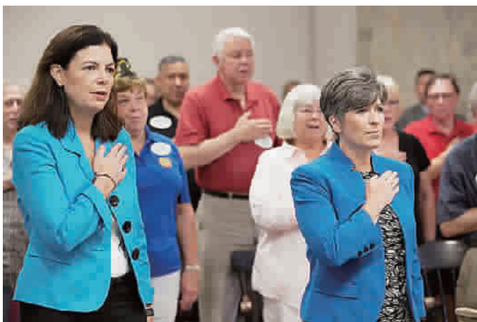
新罕布什尔州首位女性州检察长凯莉·阿约特(左)与美国第一位退伍军人出身的女性参议员乔尼·恩斯特