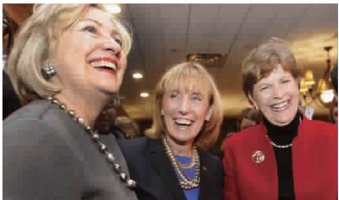
新罕布什尔州第一位女州长沙欣(右)、现任州长哈桑(中)与希拉里

干出多么了不起的事。”去年,20 名女性参议员联合起来,支持参议院通过打击性交易人口走私的重大法案。参议员沙欣还提到《防止对妇女施暴法》起死回生的例子,2012 年由于遭到共和党保守派反对,该法延期困难重重,全靠全体女性参议员协力推进,才在 2013 年重获授权。私下,女性参议员也以定期聚餐的方式加强联系。席间,女人们尽