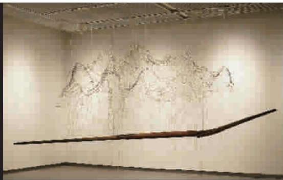
■ 吕旗彰 梦舟 鲁、钢索 200x450x80cm 2016年