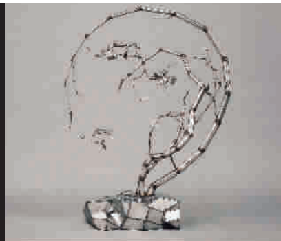
■ 郭志鹏 听风 不锈钢 120 x 160 x 60cm 2016年