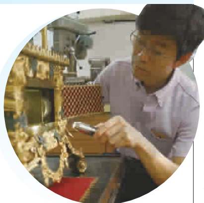
《我在故宫修文物》剧照

“借船出海”,使中国纪录片在全球赢得了更大影响力,使中国故事为更多观众知晓。如法国文化频道ARTE播出了《孔子》,美国国家地理频道播出了《秦始皇陵的惊天