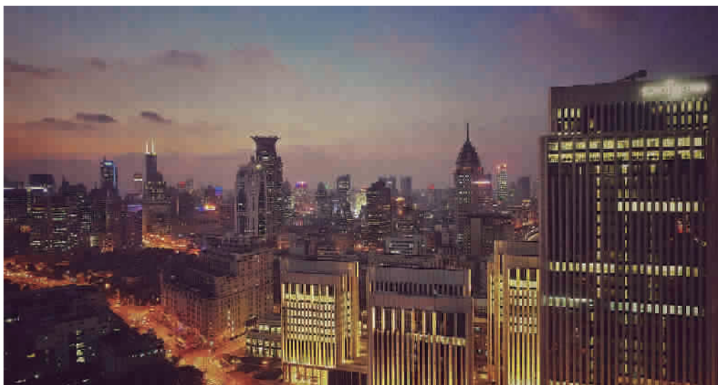
《航拍中国》中的上海夜景