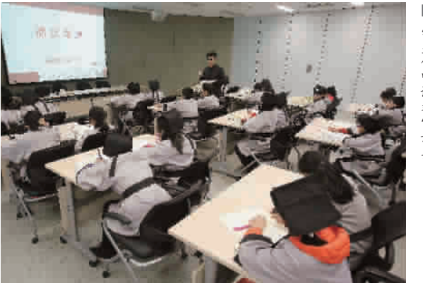
■ 学生们听课非常认真