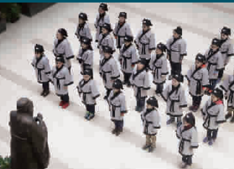
■ 学生们排好队在孔子像前诵读学规