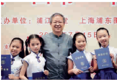
■ 鲍鹏山教授与浦江学堂明学级学生在一起