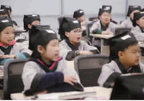
■ 浦江学堂让学生们学得很有兴趣