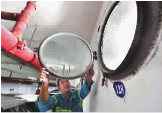
■ 工作人员将外滩防汛墙廊下的舷窗提前关闭,避免风浪大潮来时造成水涌

如果台风强劲,高速公路管理部门会视具体情况采取必要的交通管制措施,请广大驾驶人谅解。