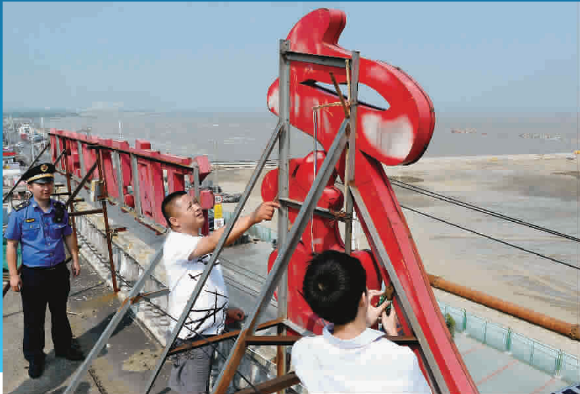
■ 昨天下午,金山区金山嘴渔村海鲜一条街商户加国店招店牌

又讯 (记者 金志刚)受台风“安比”影响,为确保旅客运输安全,中国铁路上海局集团有限公司今晨宣布暂停运行7月21日至23日部分旅客列车,其中上海地区21日停运11趟旅客列车,22日停运77趟,23日停运2趟。