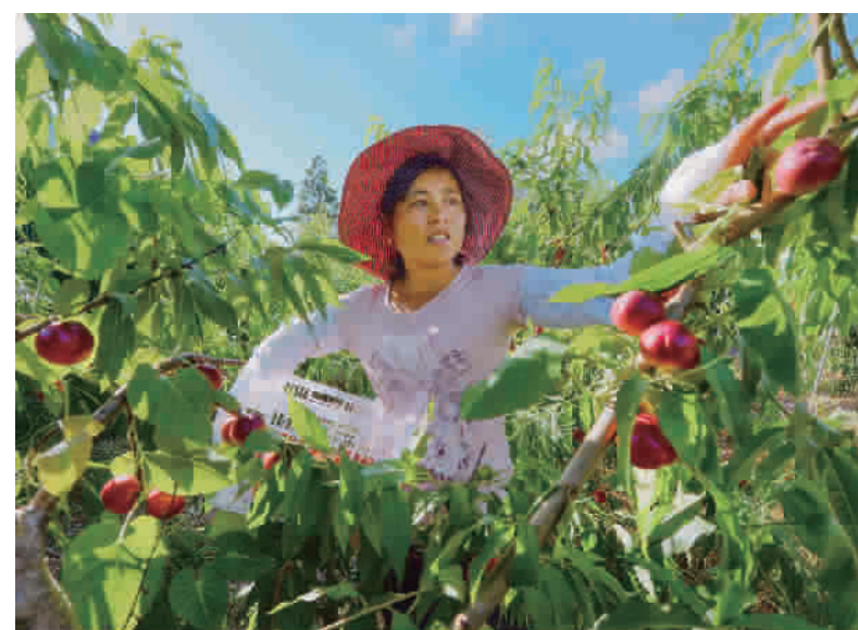
天气炎热,上海金贵枣油桃种植专业合作社的枣油桃也进入了成熟期。果农们顶着高温抓紧时间抢收,确保市场的供应