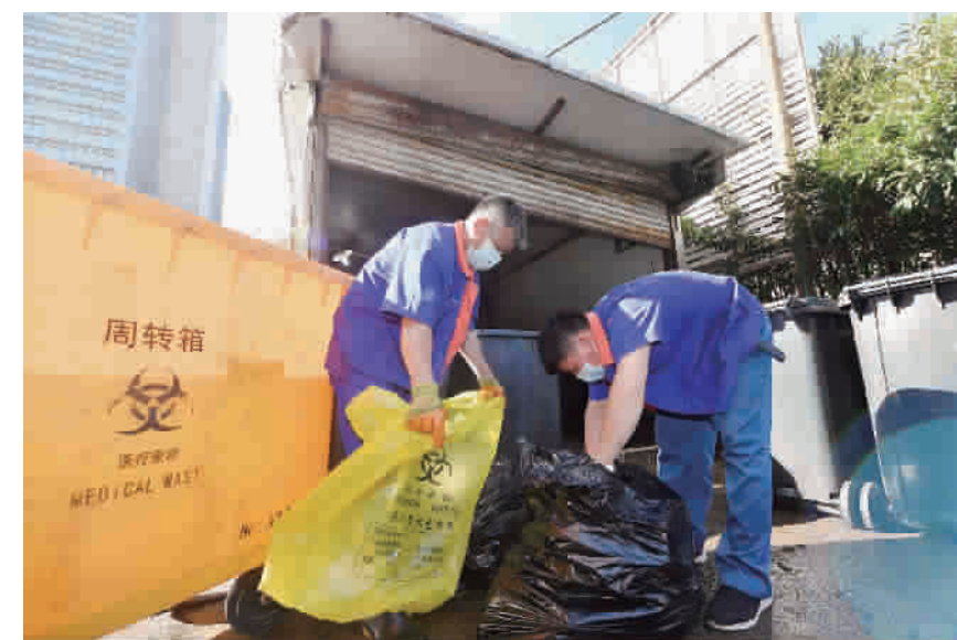
在充斥着刺鼻异味的环境中,东方医院运行保障部门的师傅们头顶烈日,正在对生活垃圾中残留的医疗废弃物垃圾进行分拣