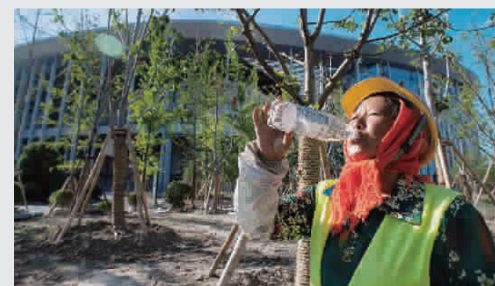
高温下,长时间户外工作的国家会展中心工人正大口补水

热浪滚滚下,数以万计的户外工作者们不辞辛苦、奋战高温,让上海这座有温度的大都市更加充满活力。