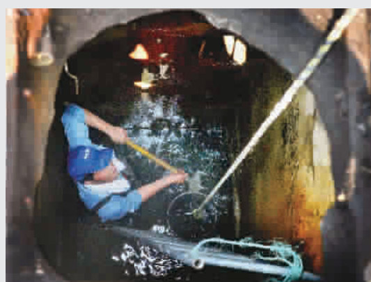
黄浦区市政养护工人在又热又臭又狭窄的雨水窨井里清除井底的淤泥