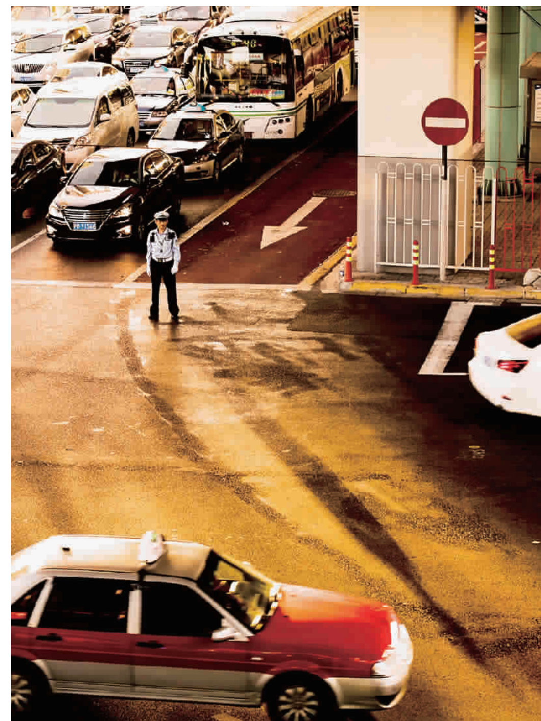
金色斜阳为奋战在一线的交警拉出长长的身影