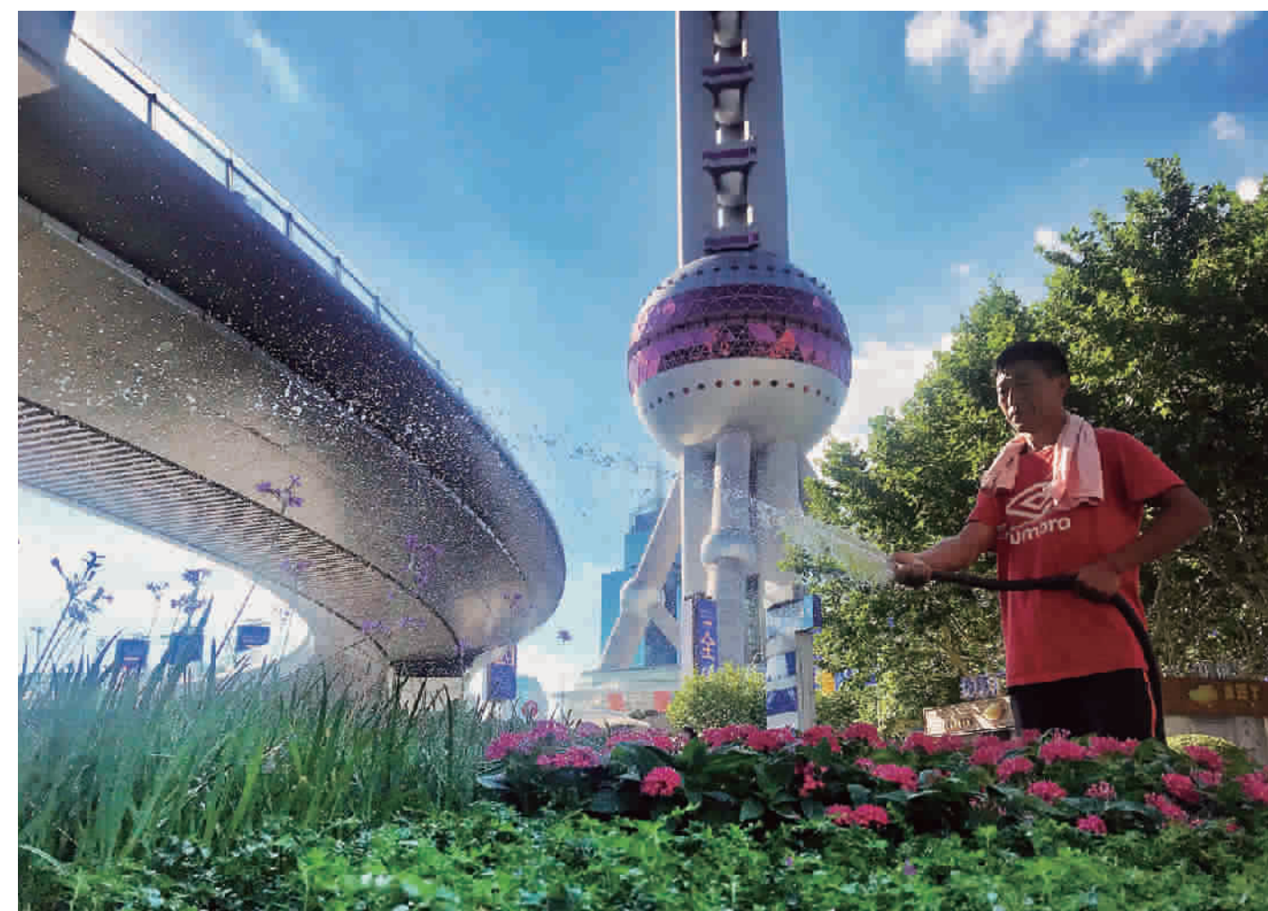
虽近傍晚,但太阳依然火辣,绿化养护工在酷暑中为花草送去清凉