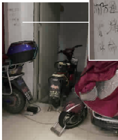
消防通道被电动车堵住,有居民在墙上写下“消防通道不要堵上,求(救)命通道”

但当记者走进居民楼实地查看时,却发现这些不过是说说而已。在4年前曾发生大火的24号楼,记者沿着消防楼梯逐层踏访,发现几乎每层的楼道或电梯间都停放着电动车,少的一二辆,多的三四辆,有些车直接停在消防通道上,挡住了通往楼梯的大门。在“消防通道,