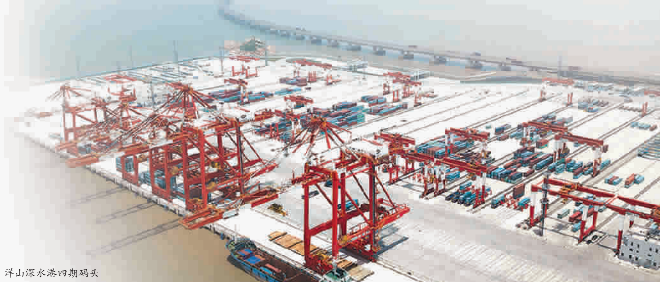
洋山深水港四期码头 本版制图 邵晓艳