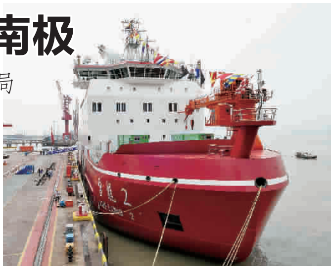
我国自主建造的“雪龙2”号可实现双向破冰

除了首航南极的“雪龙2”号,“雪鹰301”(AW169型)直升机和“南极2”号极地全地形车也正式列入执行中国第36次南极考察任务。“雪鹰301”直升机满足最新最