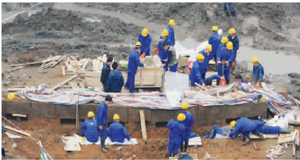
长沙开福区万达广场工地,工作人员正对古城墙进行整体切割转移作业

发掘出土的古城墙长120米,是古长沙城重要的地理坐标,反映了原来的城市格局和地形地貌变化。古城墙中有一段10多米长的南