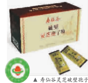
▲ 寿仙谷灵芝破壁孢子粉